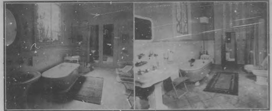
Palacio Steinhart.—Cuarto de Baños de los esposos Steinhart.