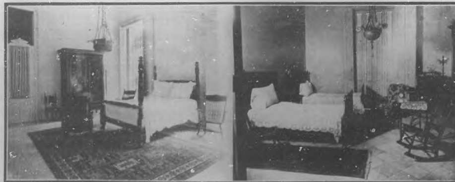
Palacio Steinhart.—Cuarto dormitorio.