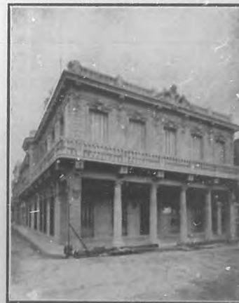
Palacio Steinhard.—Vista exterior del edificio situado en Prado y Rotondo.

De estos, de su posición social, de su cultura y hasta de su educación puede formarse pronto idea quien visite un "interior".