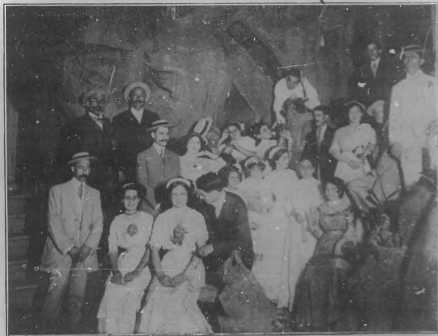
VERBENA DEL "CLUB GIJONES"—Grupo de concurrentes.

Así sea para tranquilidad de todos, y en bien del orden, que tan necesario es á la República.