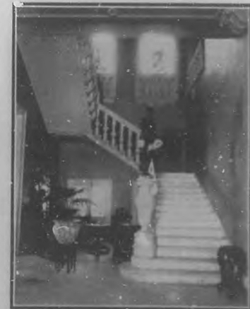
Palacio Steinhard.—Escalera de entre 1.

Y la impresión que sacará todas de electores una casa produce lo que ha habitado por persona rico hermanado con lo práctico elevado, al lector más útil, lo bien nos alegre con parece que artístico. Desde los salones en que lucen